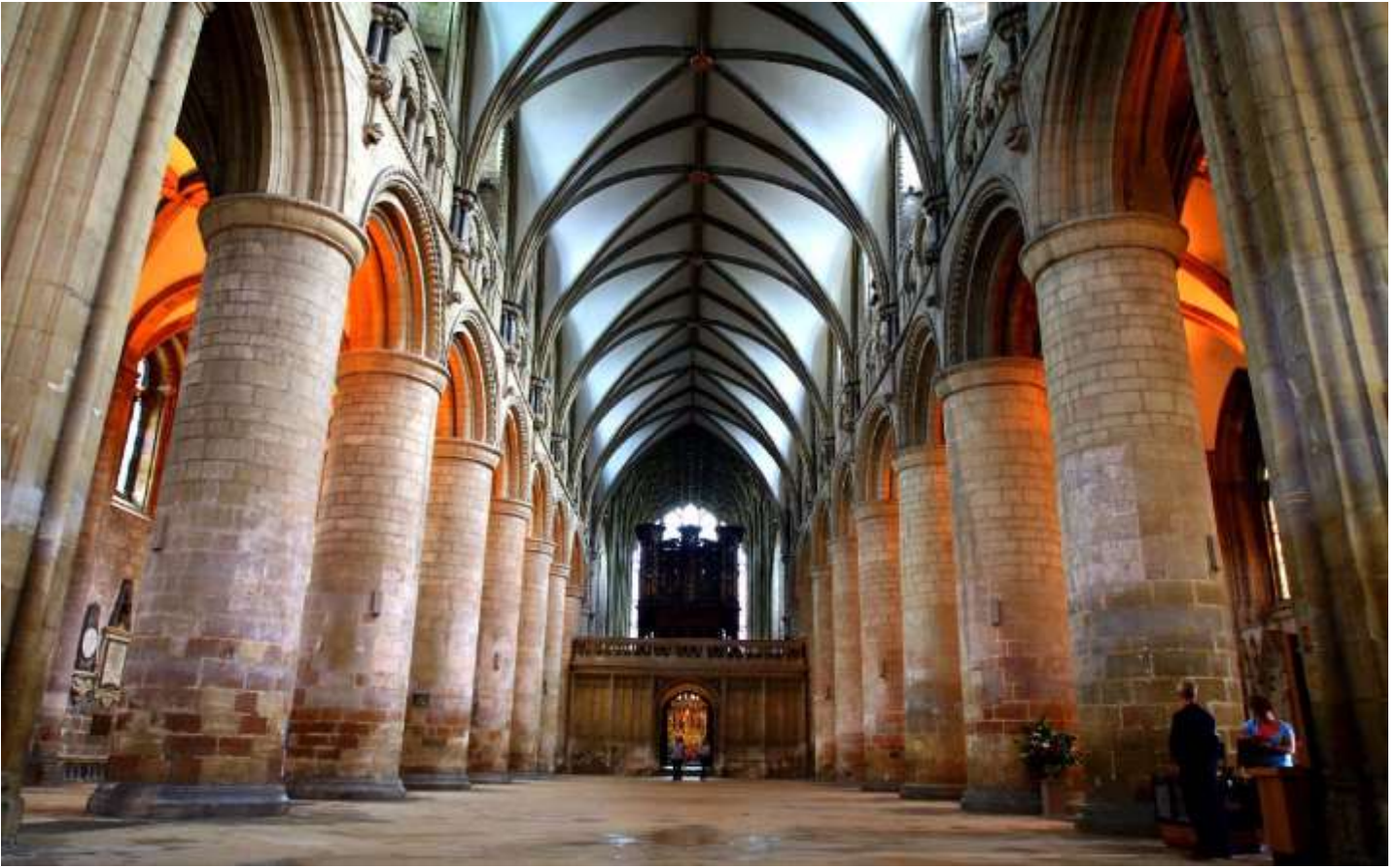
วันที่ห้า เมืองกลอสเตอร์ - อาสนวิหารกลอสเตอร์ - หมู่บ้านไบบูลรี - เมืองเบอร์ตัน ออน เดอะ วอเตอร์ - เมืองออกซ์ฟอร์ด - มหาวิทยาลัยออกซ์ฟอร์ด - มหาวิทยาลัยเคมบริดจ์ - มหาวิหารเคมบริดจ์ - เมืองบาร (B/-/D)