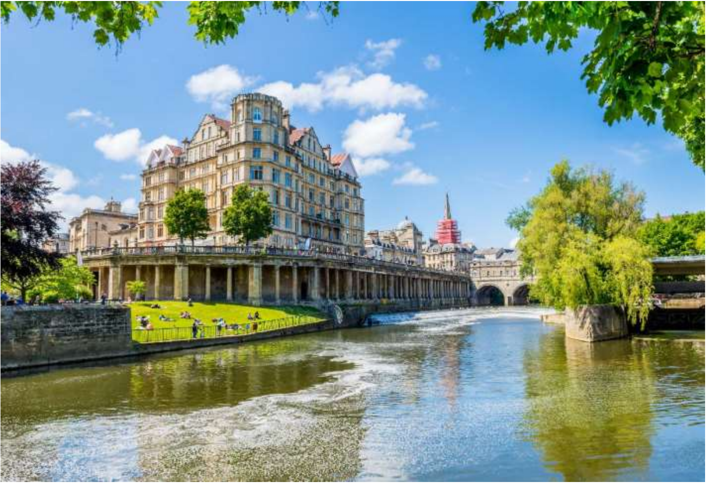
วันที่หก เมืองบาร - มหาวิหารบาร - โรงอาบน้ำโรมันโบราณ - เมืองซาลิสบิวรี - อนุสาวรีย์เสาคินสโตนเฮนจ์ - เมืองลอนดอน (B/-/D)