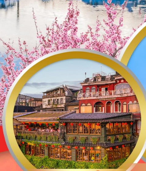
หมู่บ้านโบราณจื่อเฟิน