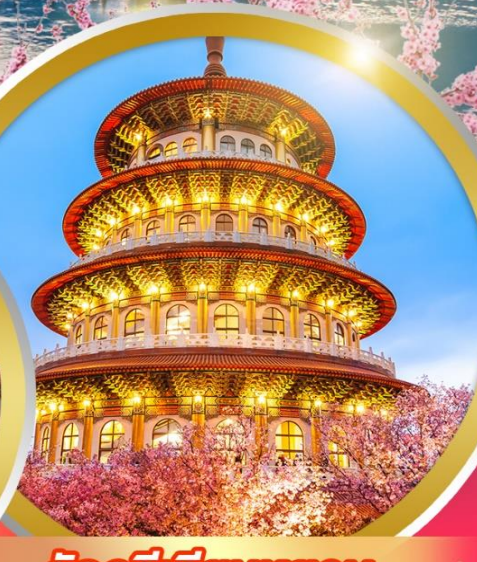
วัดอูจี้เทียนหยวน

ชมอนุสรณ์สถานเจียงไคเช็ค ทอดความรักวัดหลงซาน