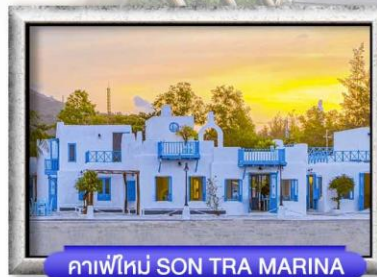
คาเฟ่ใหม่ SON TRA MARINA