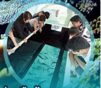
ส่องเรือท่องทะเล

ส่องเรือทะเล ชมประภาคารใต้ท้องทะเลสุดงดงาม