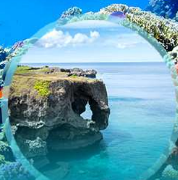
ผามินซาโมะ

บุฟเฟ่ต์กินยากิพร้อมซิมปลาภูเขาโดยเชฟมาเสิร์ฟให้กินแบบสดๆ!!