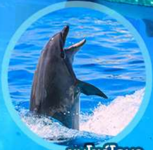
ชมโชว์โลมา