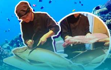
พิเศษ!! ซาซู ซาซู สไตส์ญี่ปุ่น

บุฟเฟ่ต์กินยากิพร้อมซิมปลาภูเขาโดยเชฟมาเสิร์ฟให้กินแบบสดๆ!!