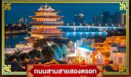
ถนนสามสายสองครอก