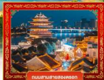
ถนนสายสองคอน