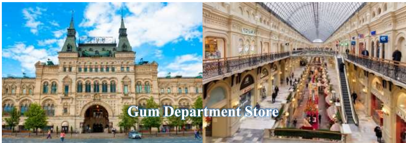
Gum Department Store

มีชื่อเสียงที่เป็นรุ่นล่าสุด (New Collection) นอกจากนั้นสามารถช้อปปิ้งได้เพิ่มอีกที่ห้างสรรพสินค้าใต้ดินบริเวณของ หลักกิโลเมตรที่ 0 หน้าจัตุรัสแดง