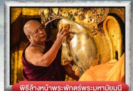
พิธีล้างหน้าพระพักตร์พระมหาชัยมุนี