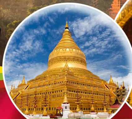
วัดเจดีย์ชเวดสิกอง