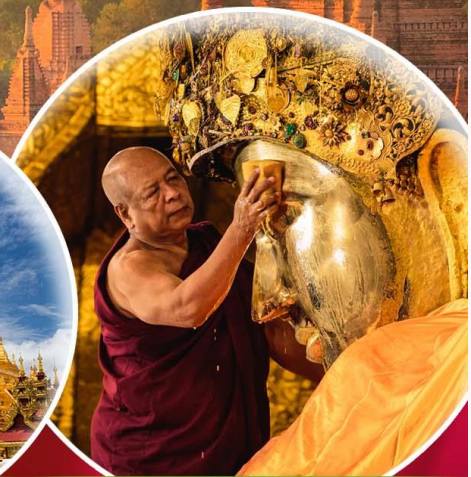
พิธีล้างหน้าพระ-พัทธกรพระ-มหาภิรมย์